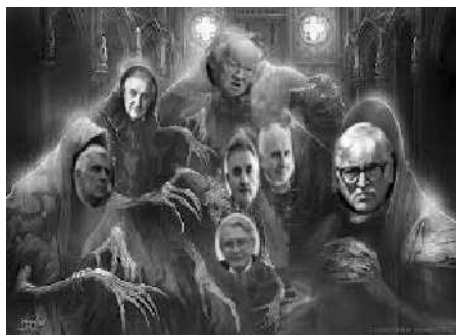
Ratnohuškački zli duši u SANU

Drugo. Predsedništvo nije ništa učinilo da pravovremeno distancira SANU od ratoborne politike srpske vlasti i od rasplamsavanja mržnje koju je nacionalizam agresivnih ljudi bez savesti, morala i ikakve duhovne vrednosti stalno podsticao. Takođe, Predsedništvo nije pokretalo bilo kakve inicijative da se zaustavi rat koji se ničim ne može opravdati i koji preti da nas za dugo vreme izbaci iz društva civilizovanih naroda, odnosno nije zahtevalo da se pozovu na odgovornost dobro poznati krivci za sve mlade živote koji su izgubljeni bez cilja, i za sva fizička i psihička unakažavanja koje je besmisleni rat doneo.”